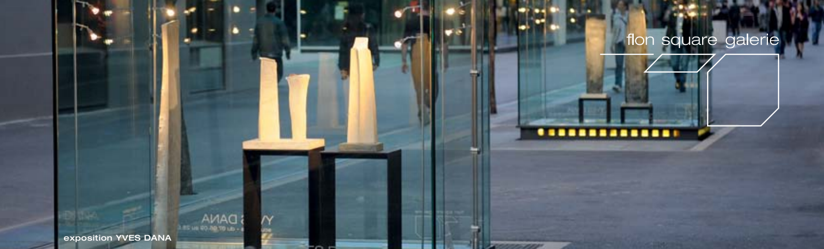
exposition YVES DANA