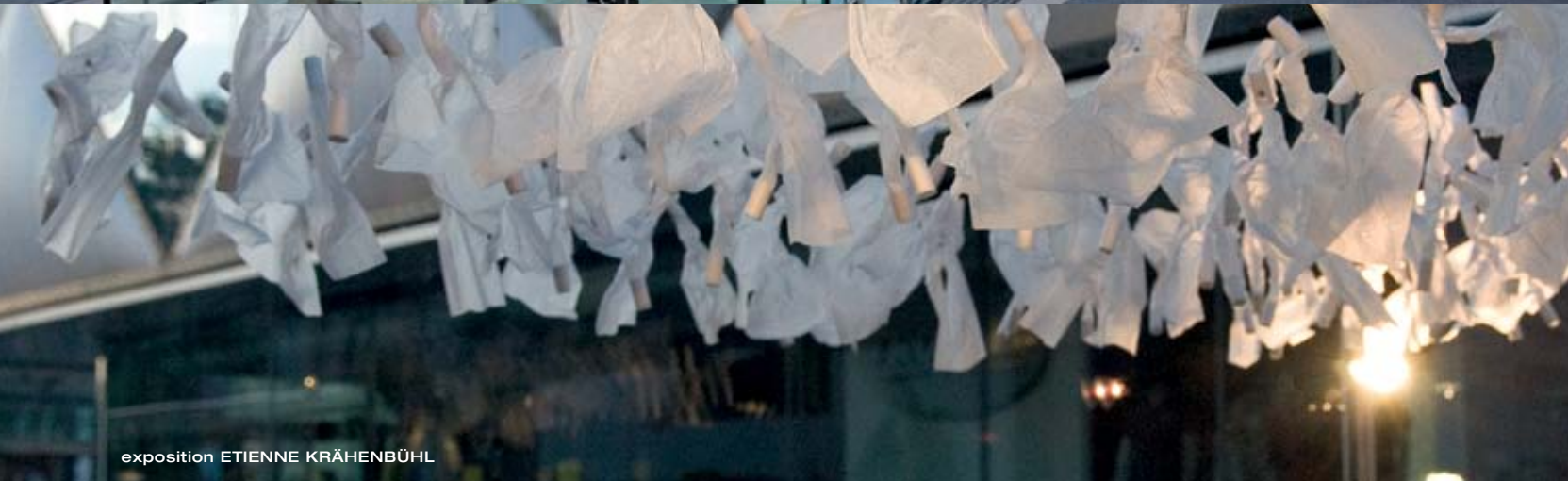
exposition ETIENNE KRÄHENBÜHL